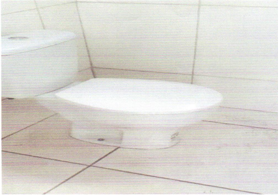
FOTO 03- VASO SANITARIO SIFONADO CONVENCIONAL COM LOUÇA BRANCA - FORNECIMENTO E INSTALAÇÃO