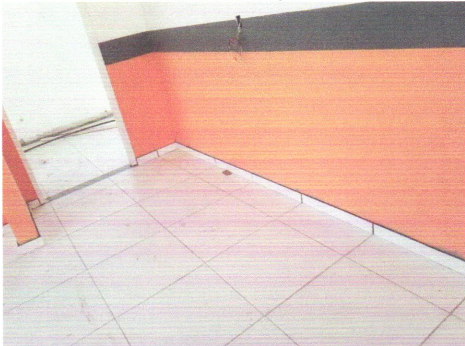
FOTO 04- APLICAÇÃO MANUAL DE PINTURA COM TINTA LÁTEX ACRÍLICA EM PAREDES, DEMÃOS. AF_06/2014 DEMÃOS. AF_06/2014