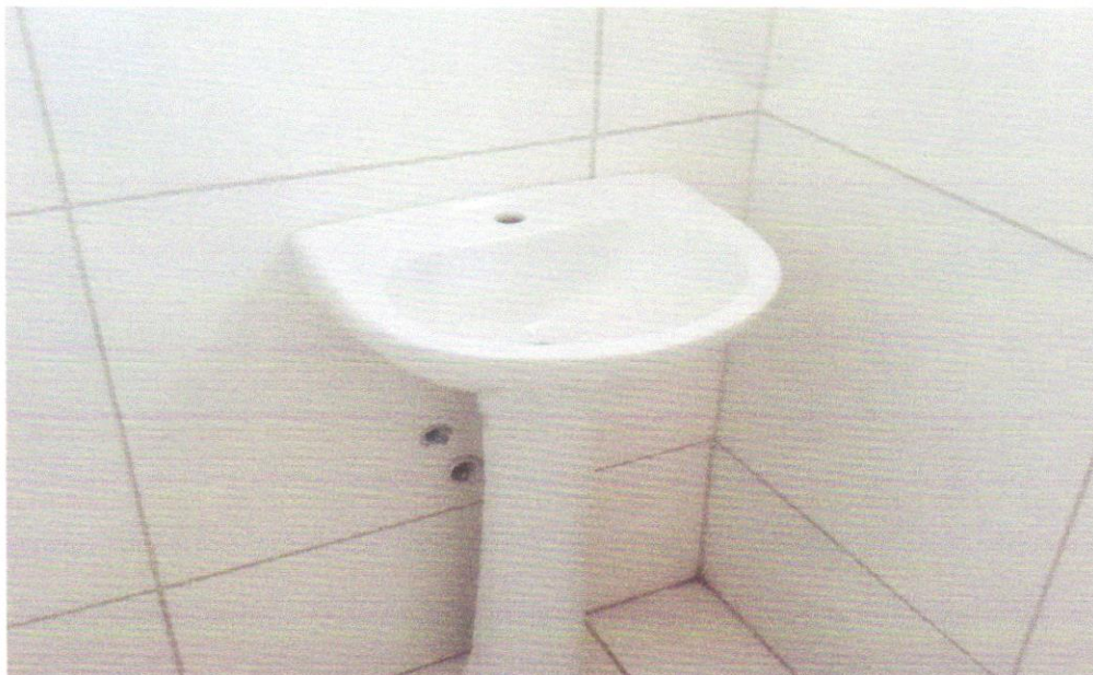
FOTO 05 – LAVATÓRIO LOUÇA BRANCA COM COLUNA, 44 X 35,5 CM, PADRÃO POPULAR, INCLUSO SIFÃO FLEXÍVEL EM PVC, VÁLVULA E ENGATE FLEXÍVEL 30CM EM PLÁSTICO E COM TORNEIRA CROMADA PADRÃO POPULAR - FORNECIMENTO E INSTALAÇÃO. AF_01/2020